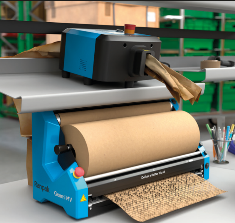
纸制空隙填充解决方案